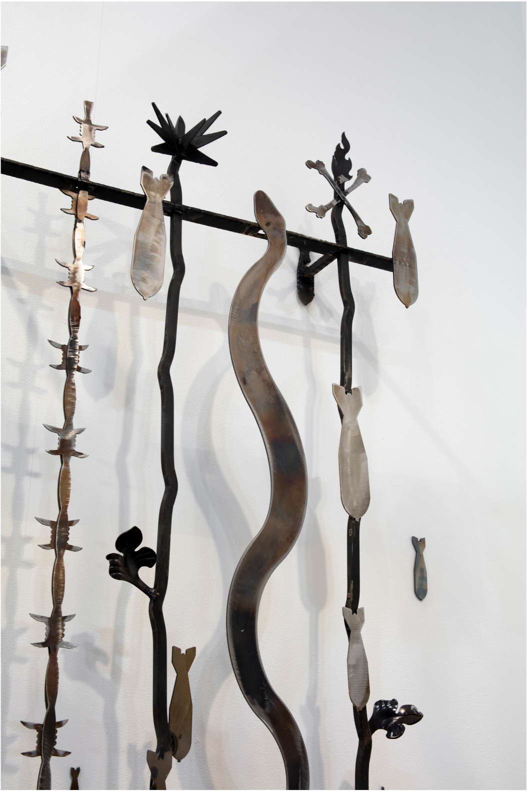
Espadas de hierro