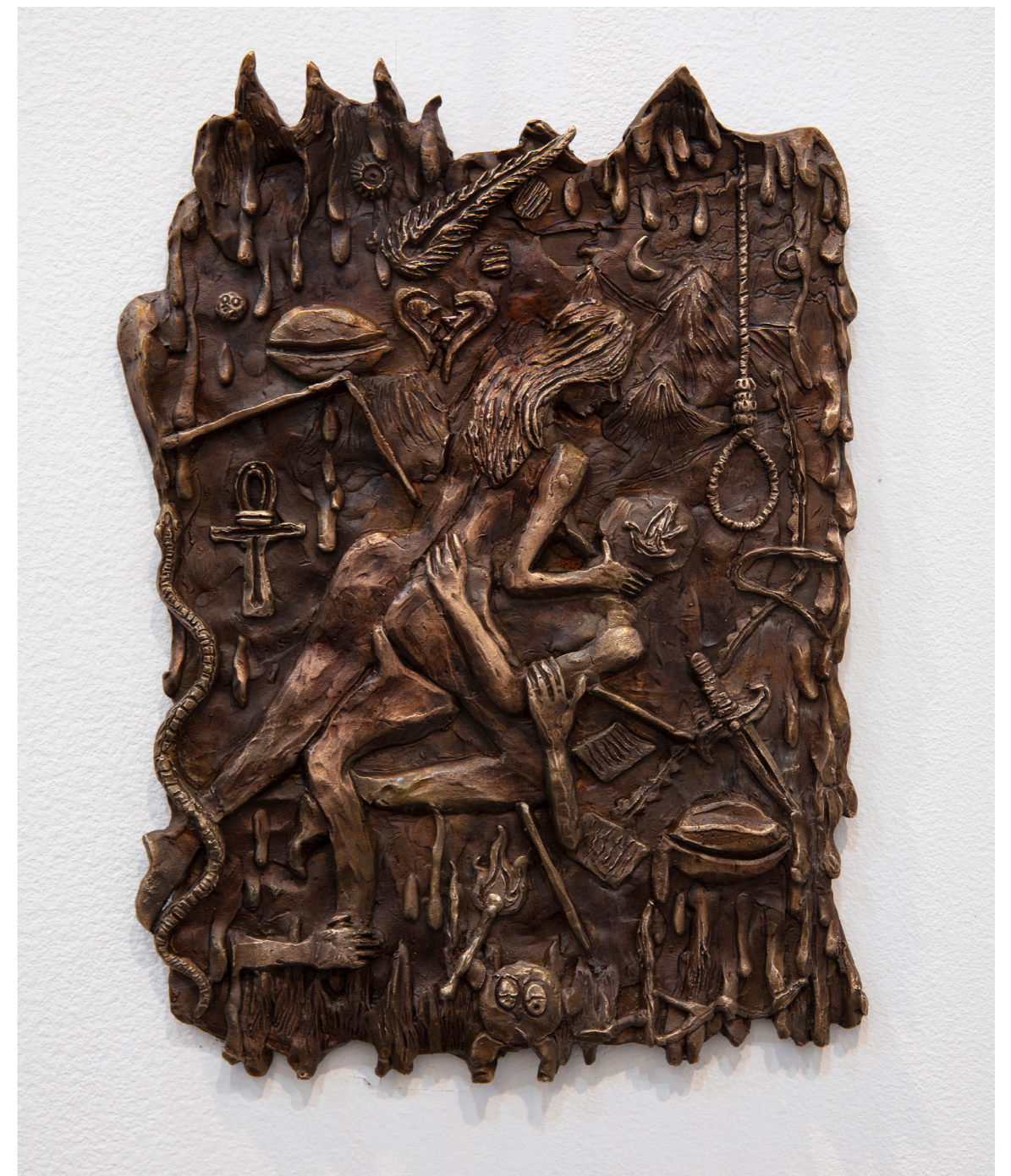
Des-empatia de la serie Cita con la Desventura