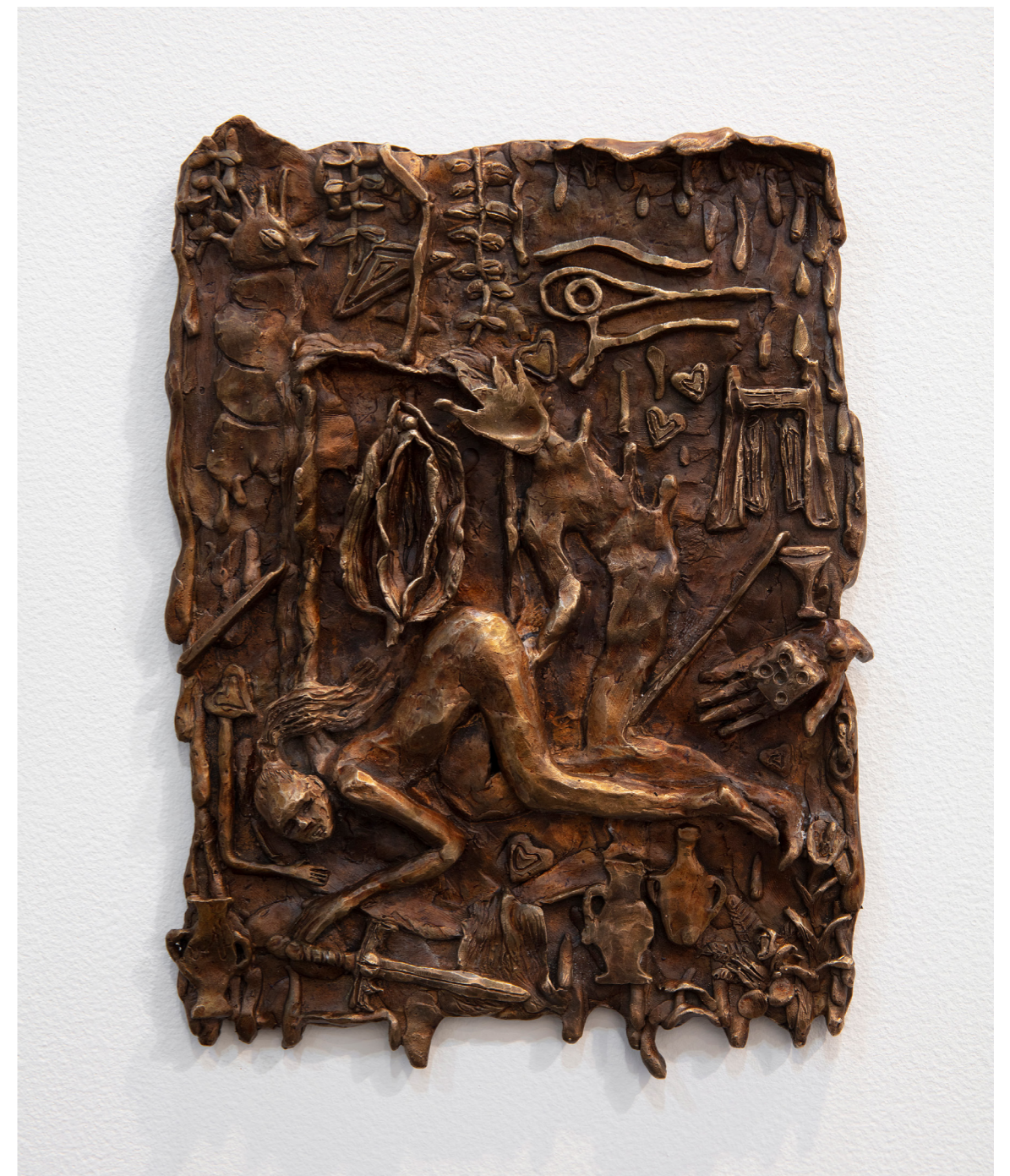
El Portal de la serie Cita con la Desventura