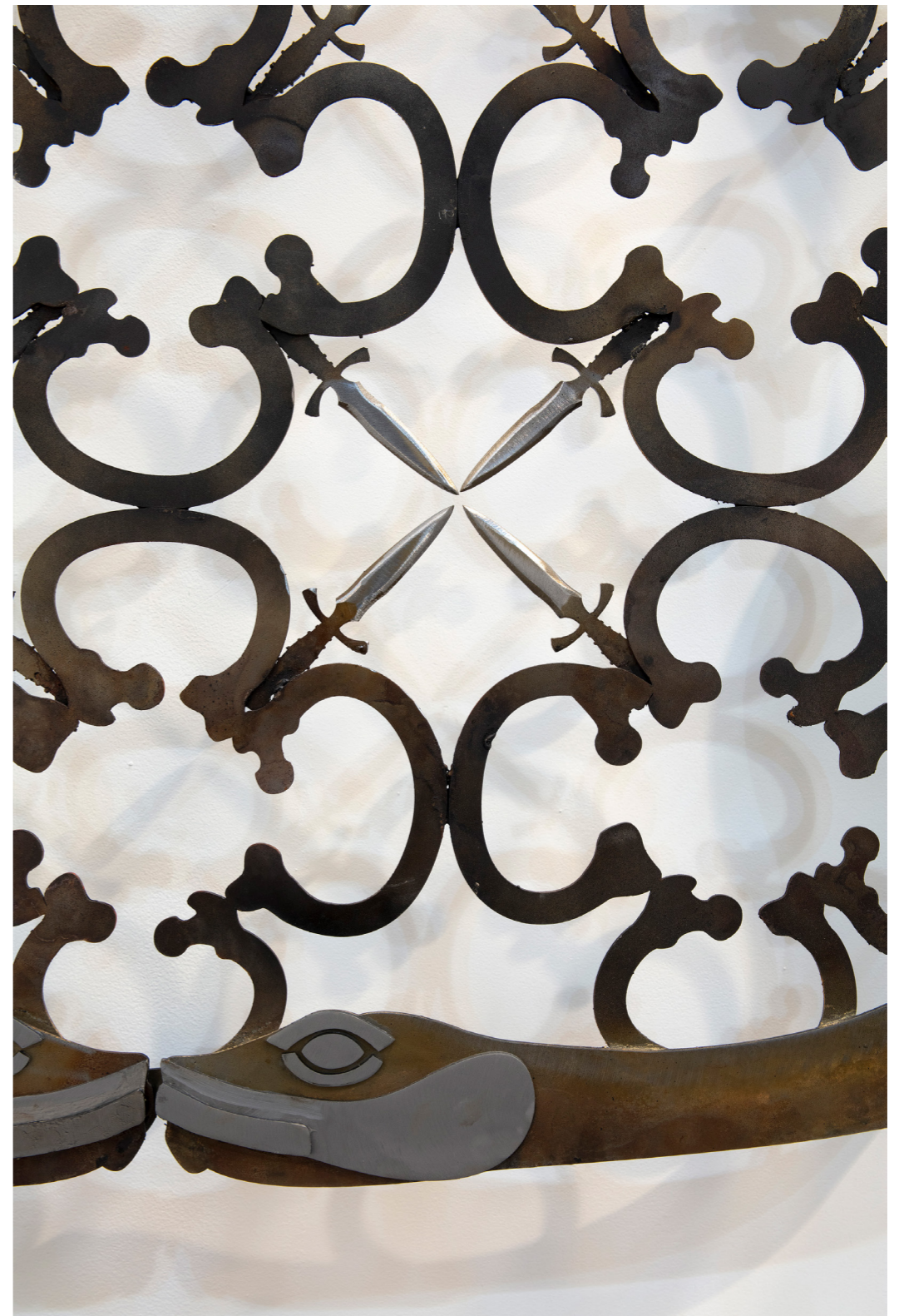
Espadas de hierro