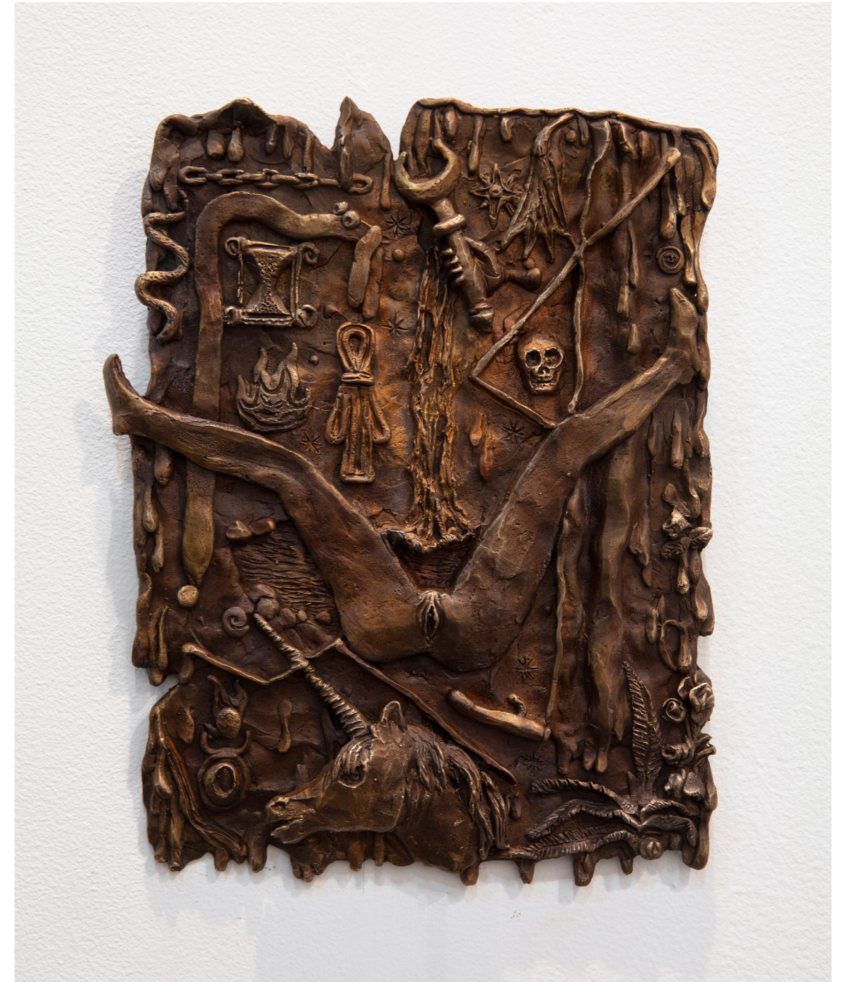
La Fuente de la serie Cita con la Desventura