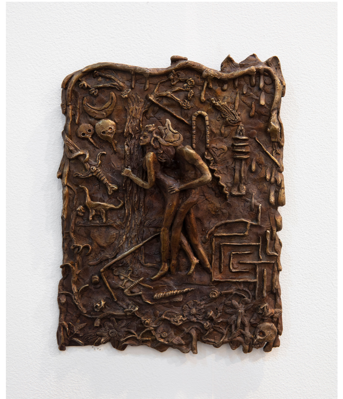
Eva y Adan de la serie Cita con la Desventura