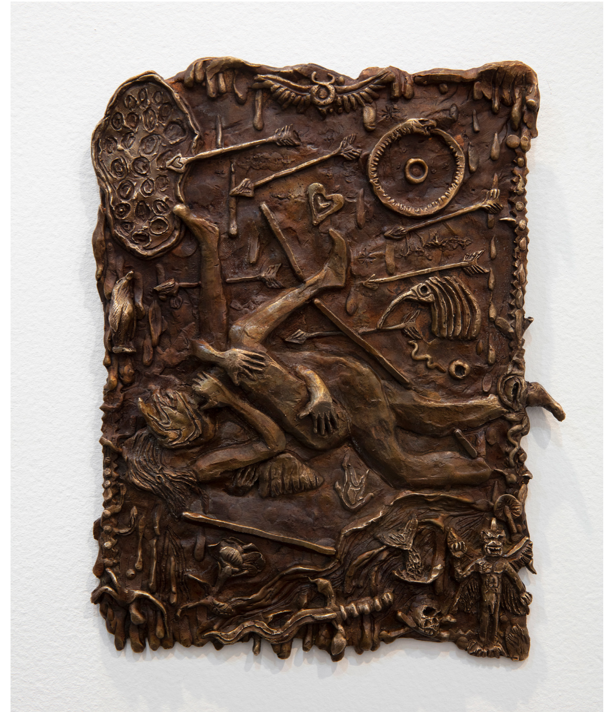
El Templo de la serie Cita con la Desventura