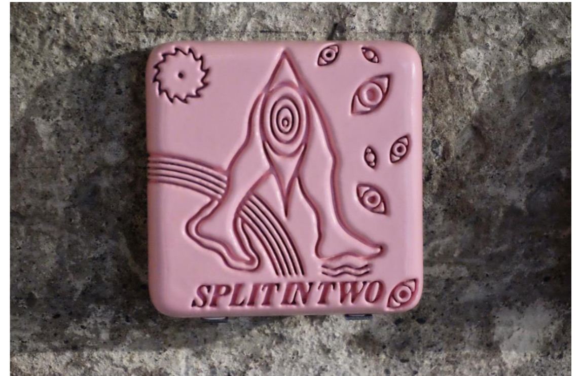
Diagrama del deseo por venir (SPLIT)

Impresión 3D, laca, esmalte acrílico 15 x 15 x 2.5 cm