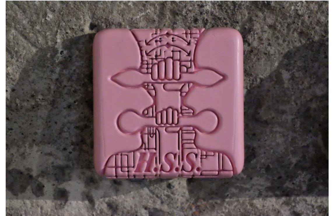
Diagrama del deseo por venir (HSS)

Impresión 3D, laca, esmalte acrílico 15 x 15 x 2.5 cm