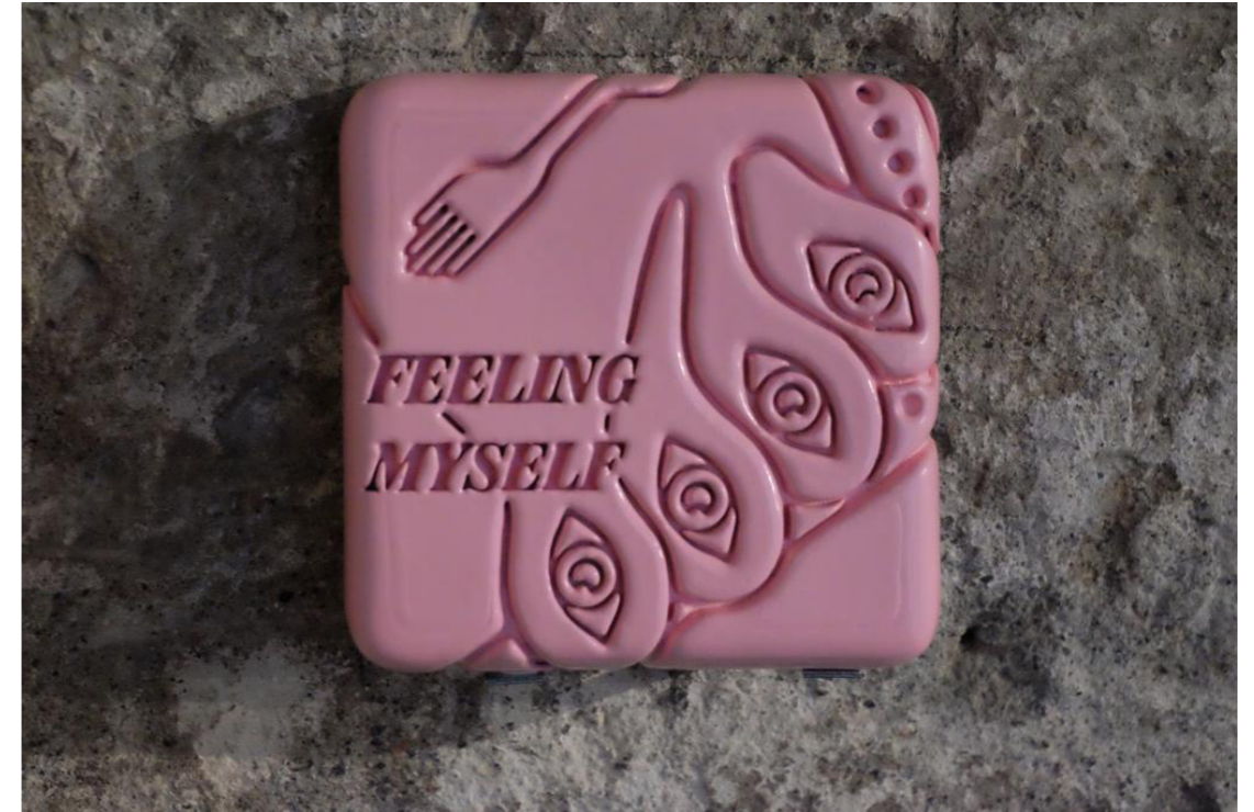
Diagrama del deseo por venir (Feeling Myself)

Impresión 3D, laca, esmalte acrílico 15 x 15 x 2.5 cm